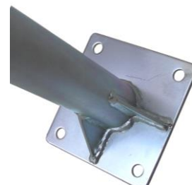
príruba KS2 (KS1-60)