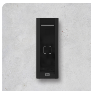
2N® ACCESS UNIT M RFID 13.56 MHZ, NFC