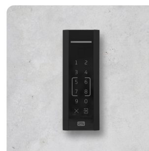
2N® ACCESS UNIT M TOUCH KEYPAD & RFID, NFC

2N® ACCESS UNIT M BLUETOOTH & RFID, SECURED, NFC 916115-S